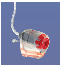
RIE ou RIC

Het zijn op maat gemaakte micro oorstukjes bestemd voor gebruik met luidsprekers in het oor van alle merken, ze worden gefabriceerd in harde hars of ThermoTec.